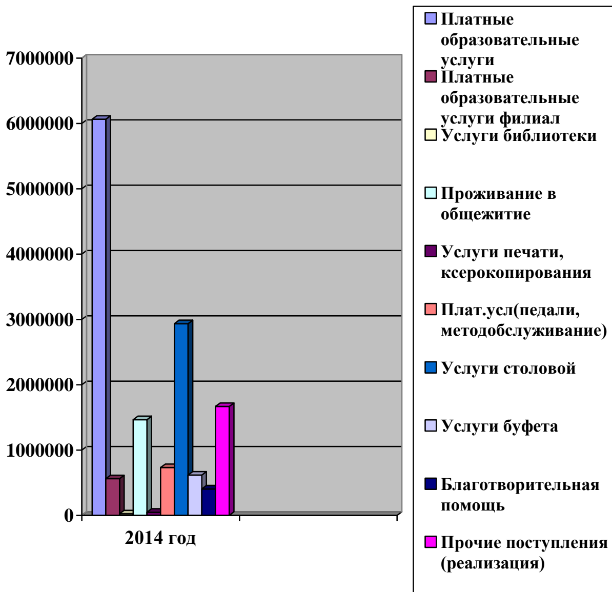
Расходы КОГОБУ СПО «ВАПК» за 2014 год